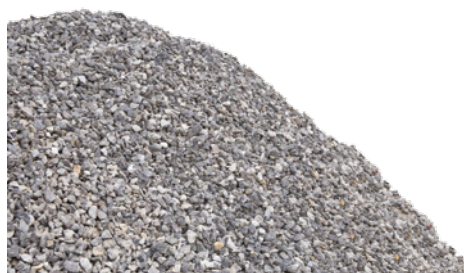
Figura 1: Drenagem natural da humidade numa pilha de agregado

Num mundo ideal, os agregados e o cimento estariam completamente secos, pelo que a quantidade de água necessária para cada lote seria um volume definido e a qualidade do betão produzido seria idêntica, lote após lote. No entanto, os agregados são normalmente guardados em pilhas ao ar livre. E, apesar de um armazenamento correto poder ajudar, até para os materiais guardados em silos cobertos, a humidade nos agregados varia constantemente devido aos efeitos inevitáveis da drenagem.